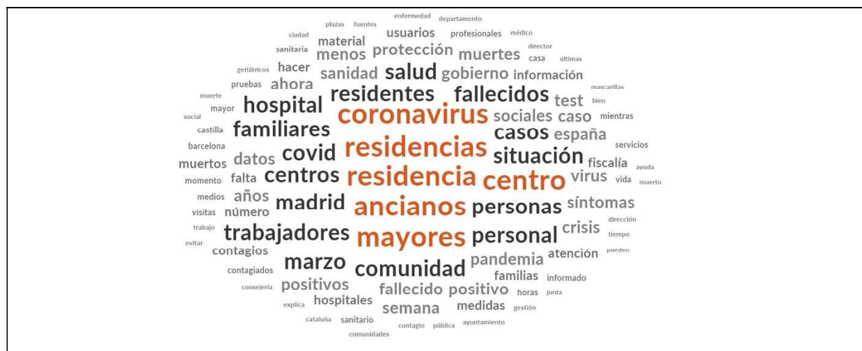
Figura 1. Consulta de frecuencia de palabras con NVivo.

La Figura 1 muestra la representación visual de palabras frecuentes, a partir de coincidencias exactas. La presencia de palabras se expresa proporcionalmente con el tamaño y el color.